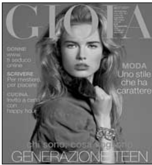
La copertina di Gioia domani in regalo col Secolo